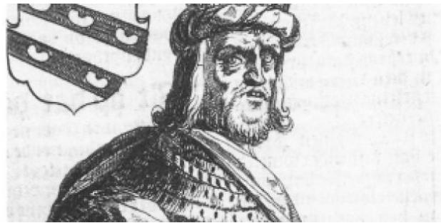
Radboud, koning der Friezen (679-719)

Ken je een vergelijkbare situatie in onze tijd?