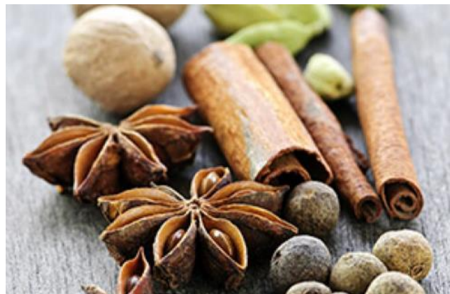
Oosterse kruiden (Bridgewaterwebshop)

Tijdens het eerste deel van de wandeling wordt bij vrij veel jaarpaaltjes even stil gestaan. Maar na jaar 700 loop je met zevenmijlslaarzen door de geschiedenis.