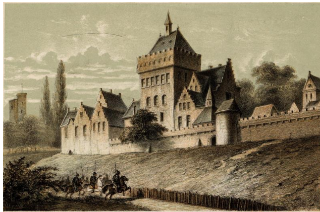
Valkhof – Nijmegen (Atlassenkaart)

Ooit kwamen Scandinavische handelaren naar Dorestad om handel te drijven. Nu vooral om te plunderen. Hoe zou dat komen?