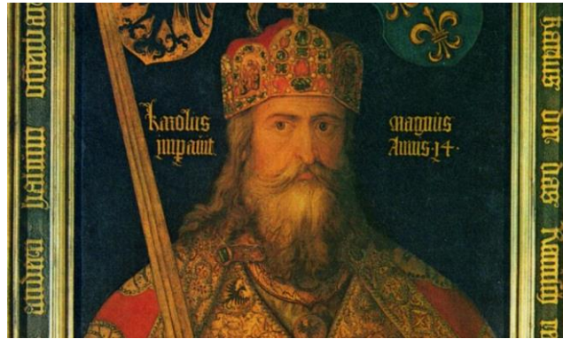
Karel de Grote (742 of 743 – 814)