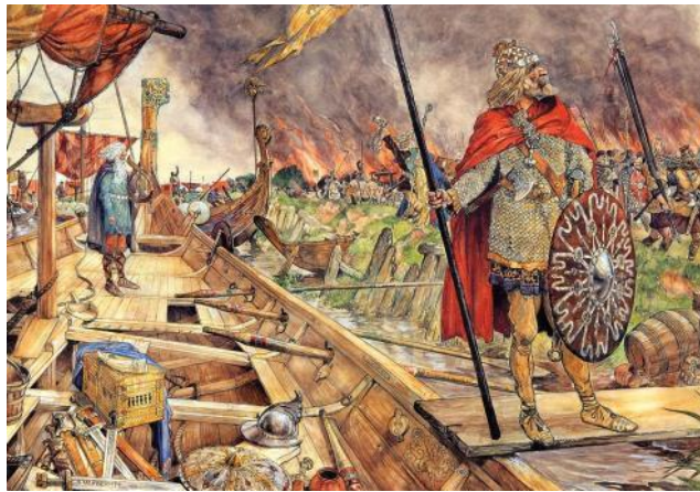
De Noormannen voor Dorestad'. Schoolplaat van J.H. Isings (1927)