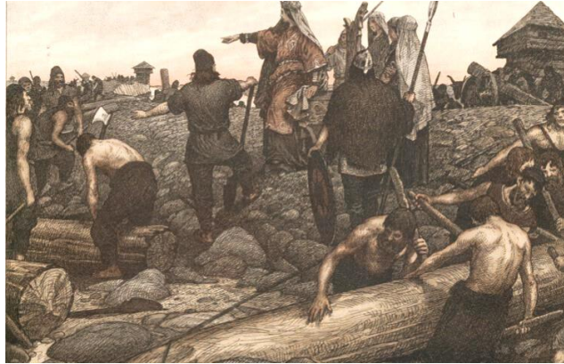
Slavenhandel van de Vikingen (Historiek)