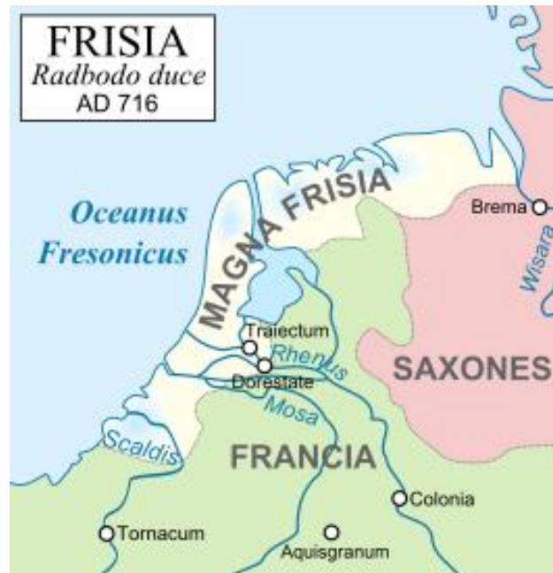
De inwoners van Dorestad zijn Friezen (Wikipedia)

het Rotterdam van nu. Dorestad was namelijk de grootste havenstad van noordwest Europa: veel handel en internationaal georiënteerd. Okay, Dorestad telde maar een paar duizend inwoners, maar vergeleken met Utrecht (400 inwoners) en Amsterdam (moerasgebied) alleszins respectabel voor die tijd.