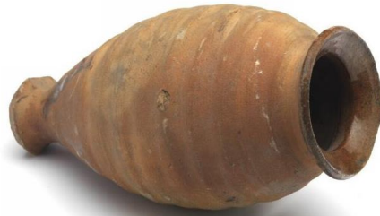
Wijnamfoor (Museum Boijmans)